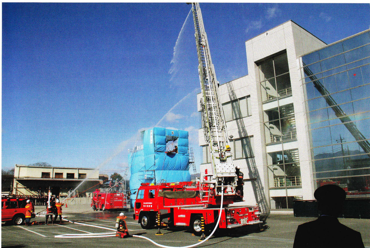
平成23年 秩父広域消防出初式