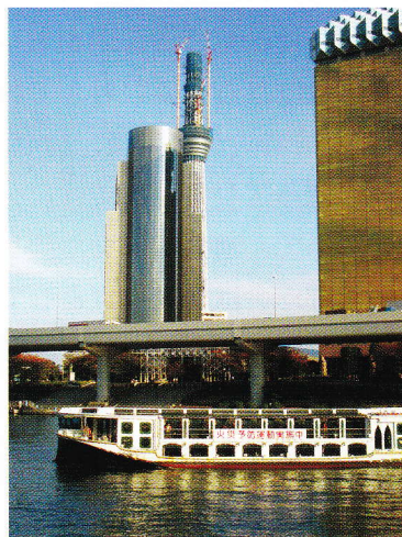
東京スカイツリー遠景